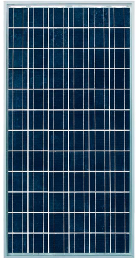
SCHOTT POLY™ 165/170/175/180