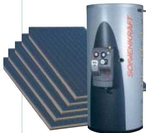
Capteurs plus réservoir COMBI