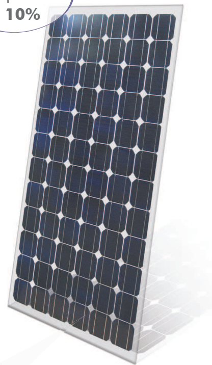
De 150 à 185Wc Suivant la classe